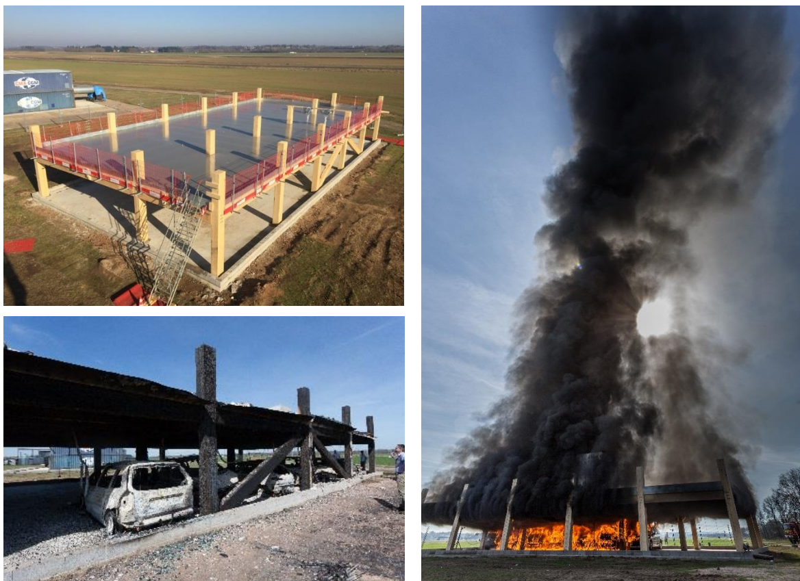
Figure 3 : Essai démonstrateur de PSLV en bois à l'échelle 1:1 (conception ARBONIS).